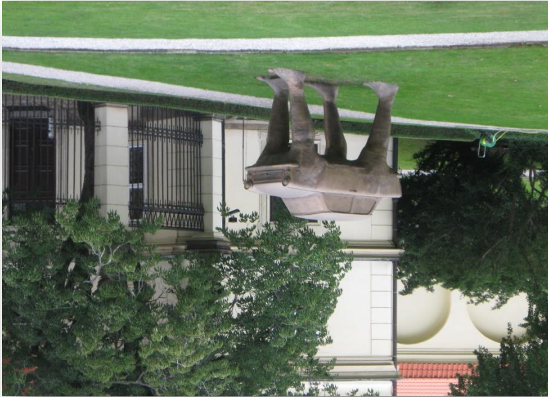
Prag, Deutsche Botschaft