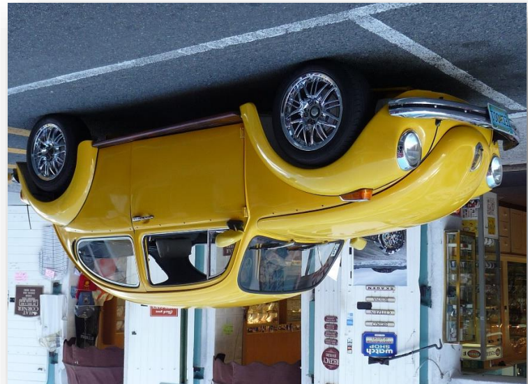
St. Thomas, Karibik

Wie will ich mobil sein? Wie kann ich mobil sein?