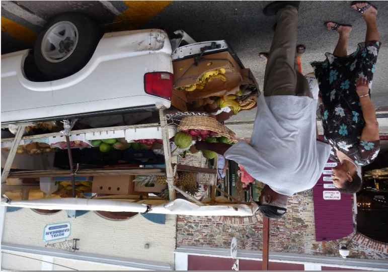
St. Thomas, Karibik